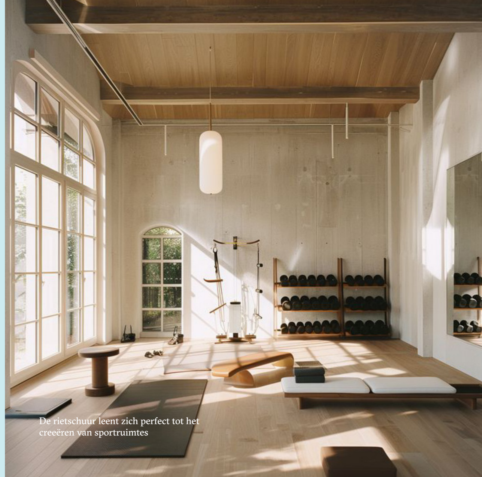
De rietschuur leent zich perfect tot het creëren van sportruimtes